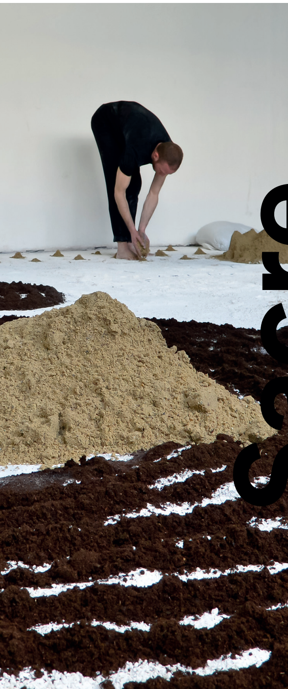
Sacre Résidence de recherche et de création au Point Éphémère Paris - Mars 2017