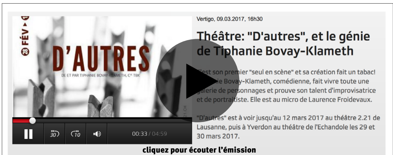
Vertigo, RTS, 09 mars 2017