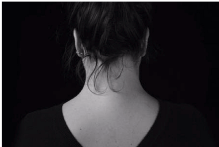
L'affiche du spectacle.

Théâtre La comédienne lausannoise réussit avec son premier solo, D'autres, une performance ethnographique troublante autant qu'hilarante. Critique.