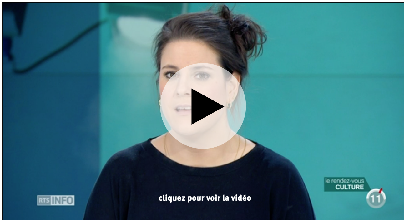
L'Invitée culturelle, 12h45, RTS, 20 mars 2017